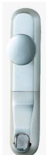
5 200 ZW

Кнопф- неповоротна кругла ручка- 5 200 ZW Гріфплатте- непов. плоска ручка – 5 200 ZW/703 В- нажимні ручки з обох боків - 5 200 B