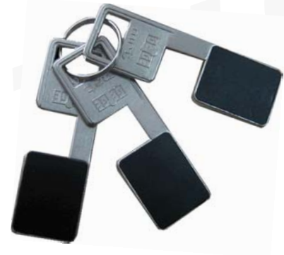
Магнетний ключ модель 5 000

Кольори: F1- сріблястий; F2 – мельхіор (світло-жовтий), анодований; F3- золотистий, анодований; MC- коричневий; Weiß- білий