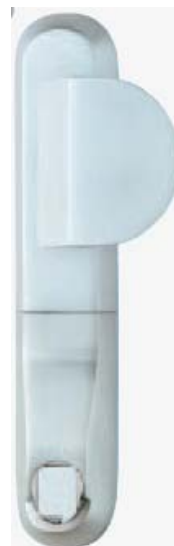
5 200 ZW/703