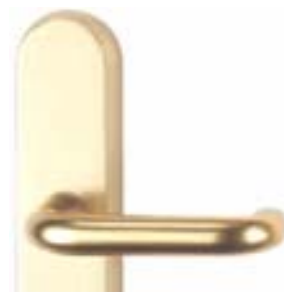
5 200 B