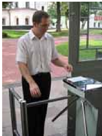
Система платного доступа «STOP-Cash 3.5» в Национальном заповеднике «София Киевская»